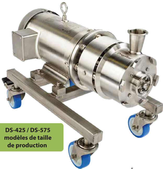
DS-425 / DS-575 modèles de taille de production

Le Dynashear représente la toute dernière technologie pour le traitement sanitaire en ligne en continu ou le traitement par lots avec recirculation. Le Dynashear mélange, dissout, désagglomère, disperse et émulsifie une large gamme de fluides et de semi-fluides. Il est particulièrement efficace pour mouiller des poudres dans un liquide. Il est doté d'une tête tandem, la première de sa catégorie, qui combine les avantages d'un étage axial et d'un étage radial, créant ainsi d'excellentes caractéristiques de cisaillement et d'écoulement. Il en résulte une réduction de la taille des gouttelettes de 2 à 3 microns et une distribution très étroite, ainsi que des capacités de débit nettement supérieures à celles des mélangeurs en ligne existants.