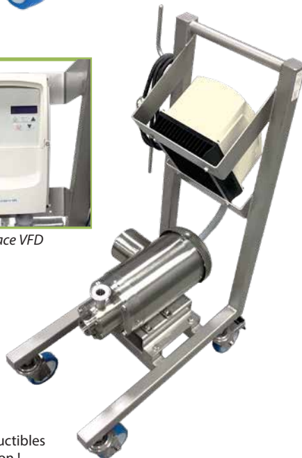
DS-215 modèle à l'échelle du laboratoire

Le DS-215 est conçu pour le développement de produits, la simulation et la mise à l'échelle. Des résultats prévisibles et reproductibles du laboratoire à la pleine production !